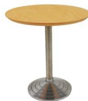
Bistrotisch / Bistro table

Buche, weiß oder Glas, Edelstahl beech, white or glass, stainless steel Ø 70 cm, H: 110 cm