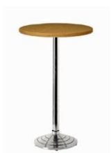
Stehtisch / Tall table

Buche, weiß oder Glas, Edelstahl beech, white or glass, stainless steel Ø 70 cm, H: 110 cm