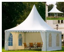
Pagodenzelt / pagoda tent

Dualkeder, weiß, Aluminium Dual piping, white, aluminum B: 5m, H: 5m