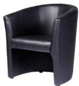
Loungesessel / Lounge chair LOLA

Anthrazit, hellgrau anthracite, light grey