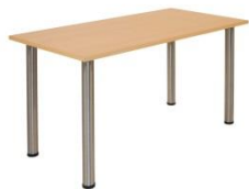
Tisch / Table

Buche, weiß oder Glas, Edelstahl beech, white or glass, stainless steel Ø 70 cm, H: 70 cm