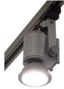
Lichtschienspot / Spot light PAR ERCO

weiß o. silber, lang o. kurz, 150 W white or silver, long o short, 150 W