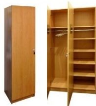
Garderobenschrank / Wardrobe GERDA

Buche, abschließbar beech, lockable 50 x 43 cm, H: 210 cm