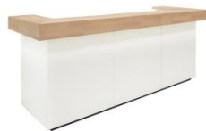
Modultheke / Bar counter EKKO

weiß, abschließbar white, lockable 100 x 45 cm, H: 115 cm