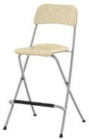
Barhocker / Bar stool EVA