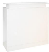
Infotheke / Info counter REGIO

weiß, abschließbar white, lockable 100 x 45 cm, H: 115 cm