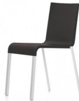
Stuhl / Chair VITRA 03

Anthrazit, hellgrau anthracite, light grey